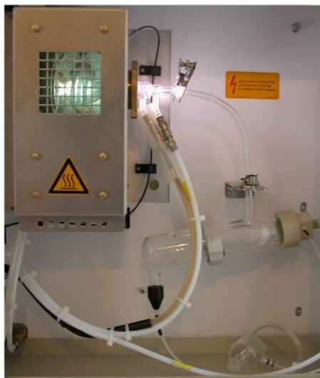
1. ábra A Spectro Genesis típusú ICP-OES készülék plazmaégője működés közben